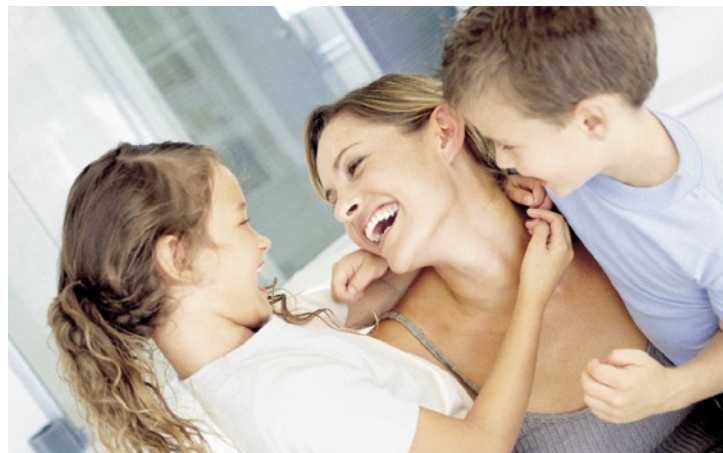
Familie: Früher Start sichert hohe Erträge

Besonderer Clou: Wer mit Riester-Fonds spart, darf nicht nur hohe Renditen erwarten, sondern engagiert sich zudem ohne Verlustrisiko. Am Ende der Sparzeit müssen die Fonds nämlich mindestens die eingezahlten Beiträge sowie die staatlichen Zulagen auszahlen. Da