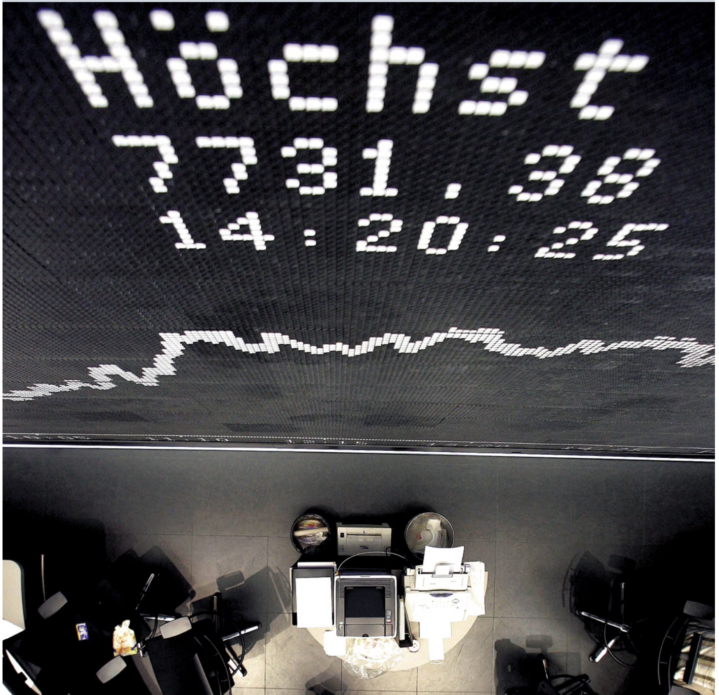
Börsenmakler in Frankfurt: lukratives Sparen mit Aktien

Im Test: Riester-Sparpläne der Fondsgesellschaften. Warum sie die höchsten Renditen bringen